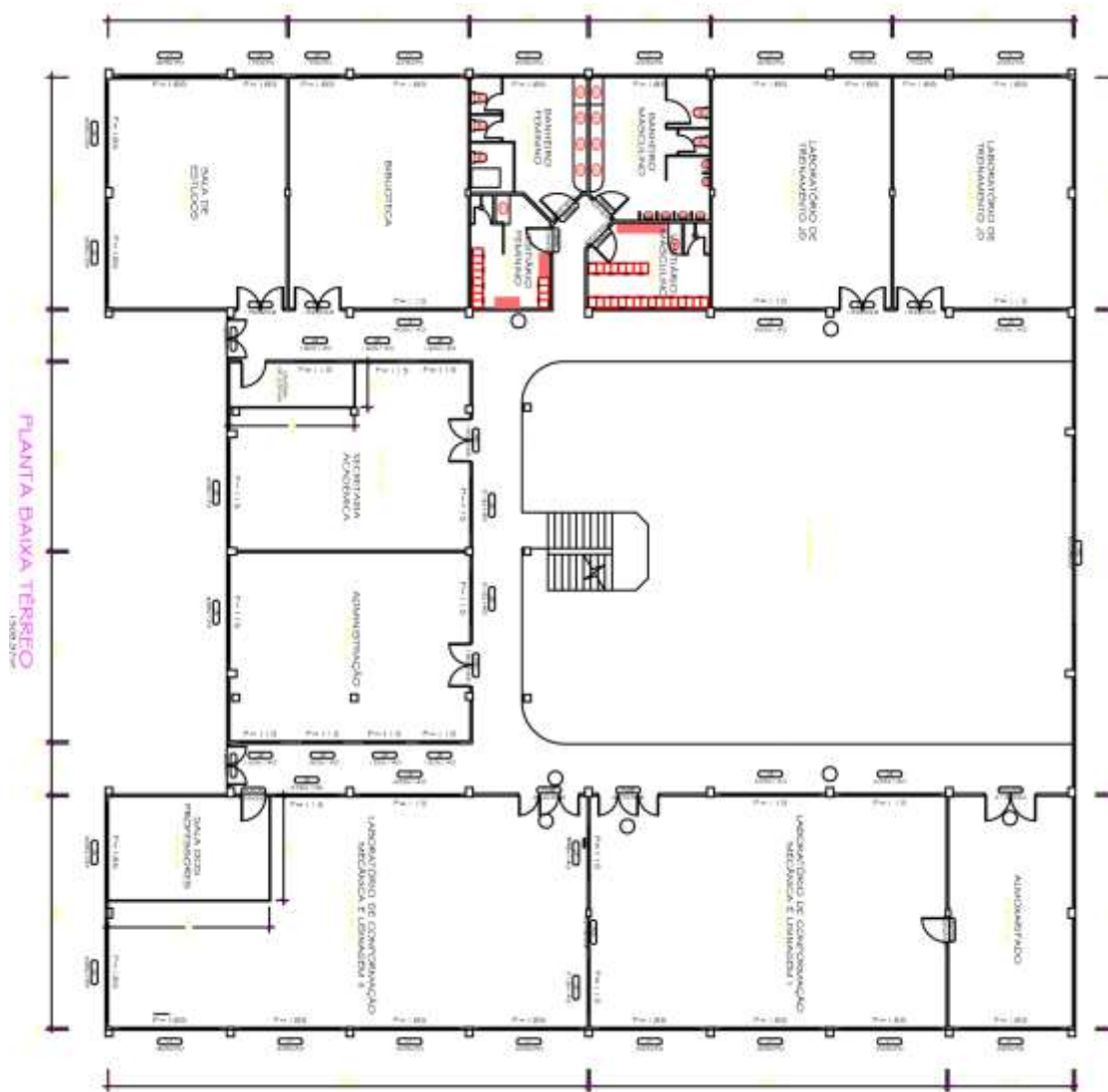
Figura 1. Primeiro pavimento do Centro de Tecnologia.

O Centro de Tecnologia e o Centro de Laboratório estão localizados no Campus Arnoldo Schneider. Nesta unidade está concentrada grande parte dos laboratórios voltados ao ensino de engenharia. A Figura 1 apresenta uma planta baixa do primeiro pavimento do Centro de Tecnologia com seus respectivos laboratórios e acomodações.