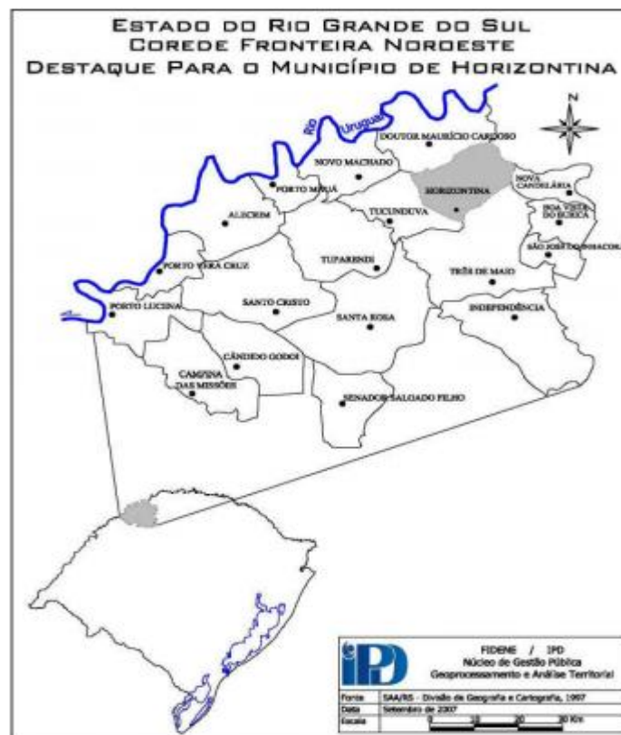
Figura 3 - Localização de Horizontina no Estado do Rio Grande do Sul.

Como pode ser visto na Figura 3, conforme COMUDE (2007), a delimitação geopolítica do IBGE, Horizontina está localizada na Mesorregião Noroeste Rio-grandense e pertence à Microrregião de Três Passos. A partir das configurações geopolíticas dos COREDES o município situa-se na Região Fronteira Noroeste e se enquadra na delimitação política e geográfica da Grande Santa Rosa, além da região fisiográfica do Alto Uruguai. Seus limites dão-se ao Sul com o Município de Três de Maio e Tucunduva, ao Norte com Dr. Mauricio Cardoso, ao Leste com Crissiumal e ao Oeste com Tucunduva.